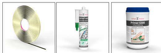
Gerband 692 Gerband 6400 Gerband 6300